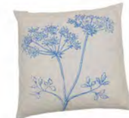
8233 | 22 50 x 50 cm (S. / P. 18)