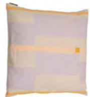
8236 | 41 50 x 50 cm (S. / P. 16)