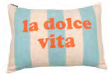
8228 | 57 40 x 60 cm (S. / P. 5)