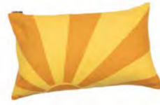
8231 | 35 40 x 60 cm (S. / P. 24)