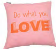
8229 | 10 45 x 45 cm (S. / P. 11)