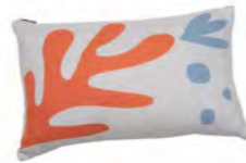
8234 | 21 40 x 60 cm (S. / P. 23)