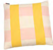
8232 | 30 50 x 50 cm (S. / P. 21)