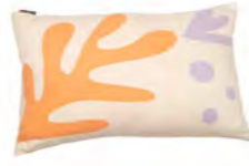
8234 | 60 40 x 60 cm (S. / P. 22)