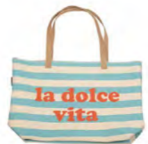
9839 | 57 64 x 40 cm (S. / P. 4)