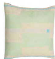
8236 | 51 50 x 50 cm (S. / P. 16)