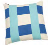
8232 | 22 50 x 50 cm (S. / P. 20)