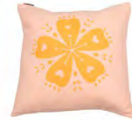
8230 | 72 50 x 50 cm (S. / P. 13)