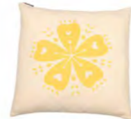
8230 | 30 50 x 50 cm (S. / P. 13)