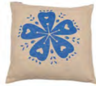
8230 | 22 50 x 50 cm (S. / P. 12)