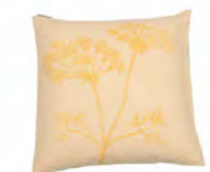
8233 | 31 50 x 50 cm (S. / P. 19)