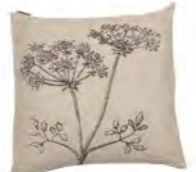
8233 | 98 50 x 50 cm (S. / P. 19)