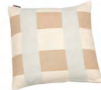
8232 | 80 50 x 50 cm (S. / P. 21)