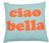
8227 | 57 50 x 50 cm (S. / P. 5)