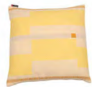
8236 | 30 50 x 50 cm (S. / P. 17)